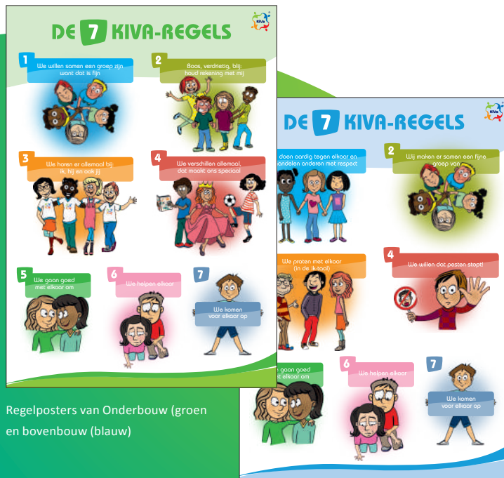
Regelposters van Onderbouw (groen) en bovenbouw (blauw)

Bij KiVa geloven we in de kracht van de groep. Bij het bedenken van goede ideeën, of het organiseren van leuke dingen, maar ook bij het oplossen en voorkomen van problemen in de groep wordt de nadruk gelegd op de verantwoordelijkheid die alle kinderen hebben voor het welzijn in de groep. Iedereen is (mede-)verantwoordelijk voor de sfeer in de groep. Hoewel niet iedereen verantwoordelijk is voor het ontstaan van een probleem, kan wel iedereen iets doen om te werken aan de oplossing. De kracht van de groep wordt ingezet voor gedragsverandering. Dit sluit aan bij de theorie van rolbenadering 1 . Door middel van KiVa leren kinderen strategieën die ze in kunnen zetten om problemen in de groep op te lossen en belangrijker nog om ze te voorkomen. Daarbij is het uitgangspunt dat iedereen (leerkrachten, leerlingen en ouders) sterke kanten heeft, die kunnen bijdragen aan een positieve sfeer. Kortom samen verantwoordelijk voor een fijne groep.